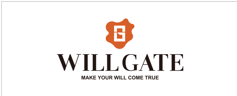
Type-Y1 : シンボル + 基本組 + スローガン