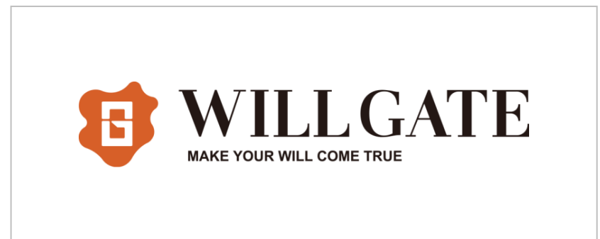
Type-X1 : シンボル + 基本組 + スローガン